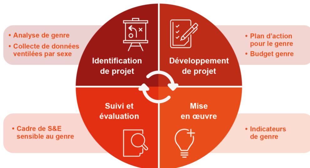
Figure 1 – Intégration du genre tout au long du cycle de projet

Comme illustré dans le graphique ci-contre, garantir l'inclusion et la réactivité au genre dans les projets nécessite que les GL entreprennent plusieurs activités tout au long du cycle du projet :